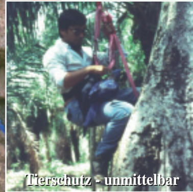
Tierschutz - unmittelbar