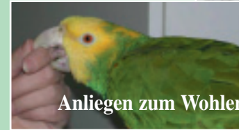
Anliegen zum Wohlergehen der Papageien