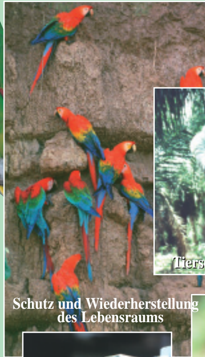
Schutz und Wiederherstellung des Lebensraums