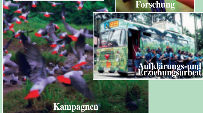
Aufklärungs- und Erziehungsarbeit